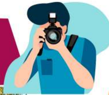
FOTO DE LA QUINCENA