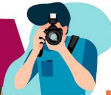
FOTO DE LA QUINCENA