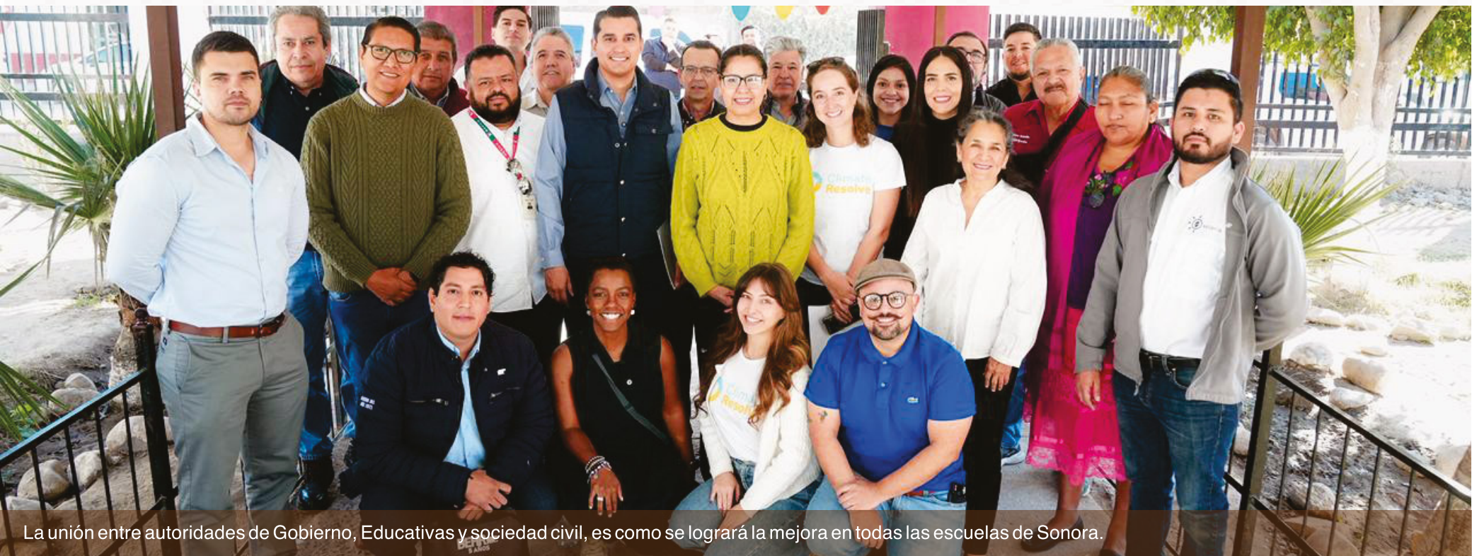
La unión entre autoridades de Gobierno, Educativas y sociedad civil, es como se logrará la mejora en todas las escuelas de Sonora.