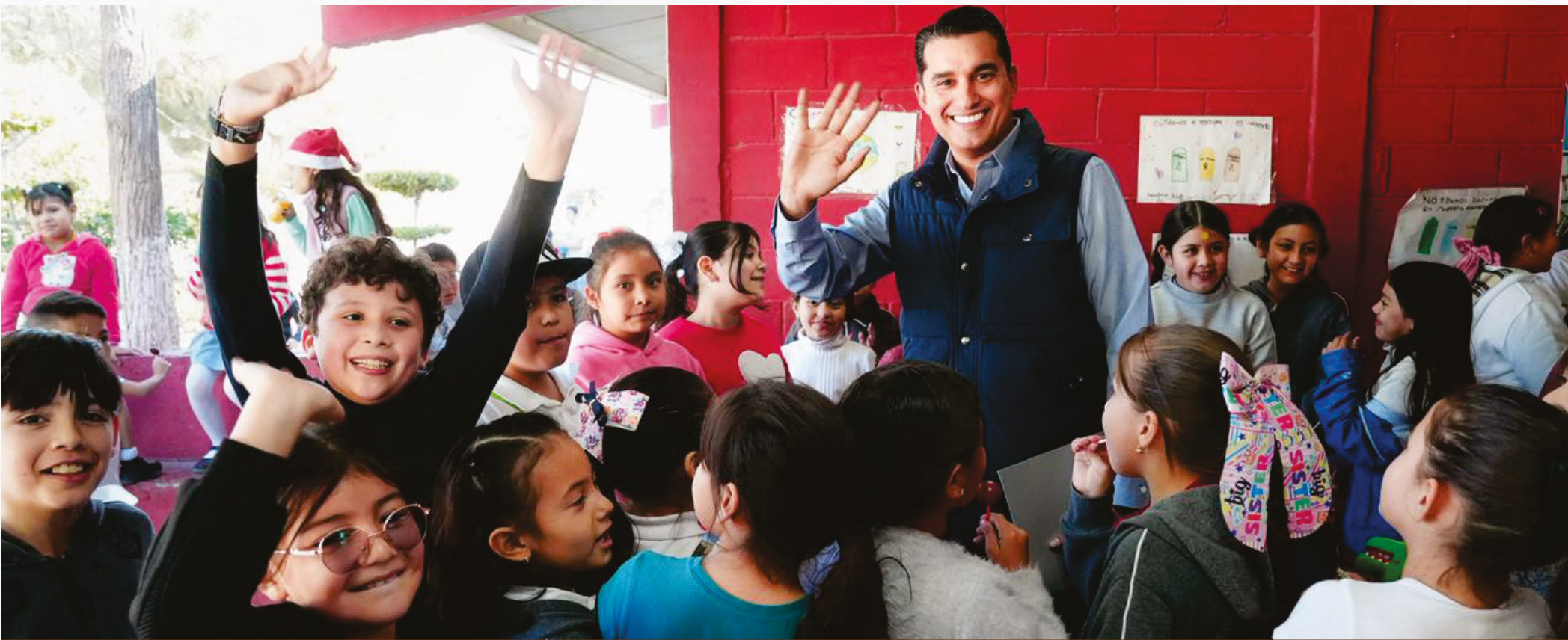
Caritas felices y mucho entusiasmo fue lo que distinguió la visita del titular de la SEC a una de las escuelas del Poblado Miguel Alemán.