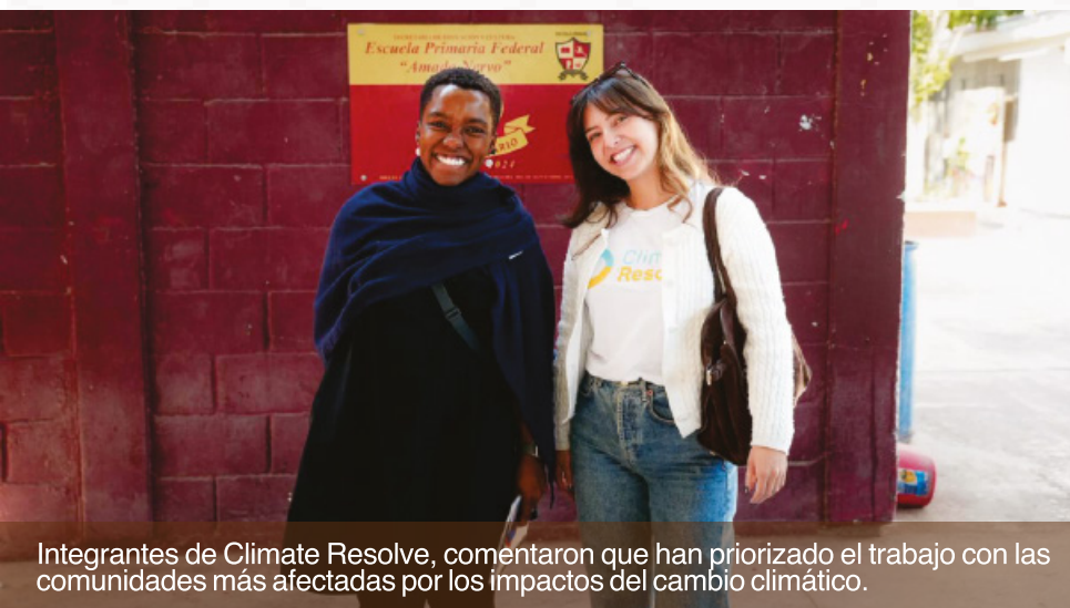
Integrantes de Climate Resolve, comentaron que han priorizado el trabajo con las comunidades más afectadas por los impactos del cambio climático.