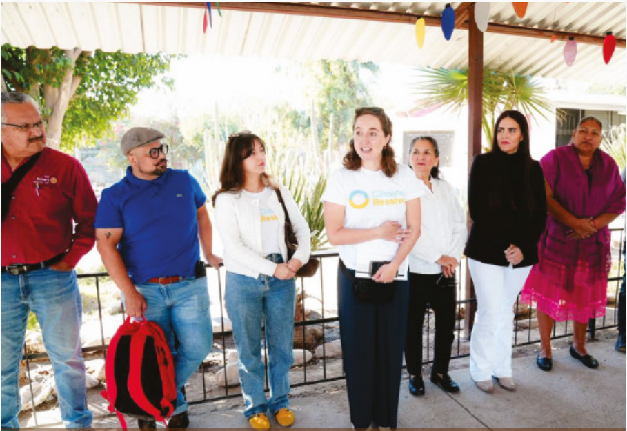
Desde su lanzamiento en 2010, Climate Resolve se encuentra en apoyo a proyectos como este.