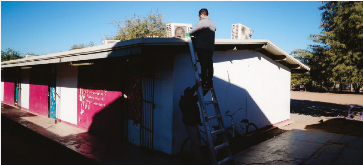
Un proceso completo de revisión es el que se lleva a cabo para hacer posible este proyecto en beneficio de nuestras escuelas y el clima.