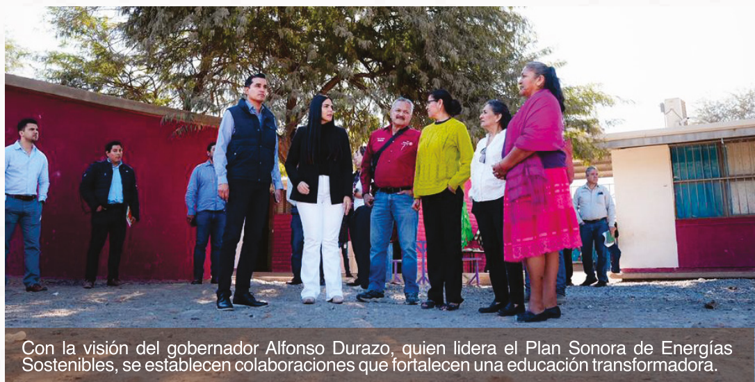
Con la visión del gobernador Alfonso Durazo, quien lidera el Plan Sonora de Energías Sostenibles, se establecen colaboraciones que fortalecen una educación transformadora.