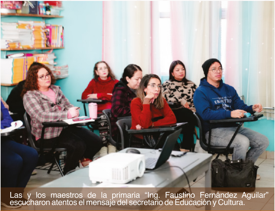
Las y los maestros de la primaria "Ing. Faustino Fernández Aguilar" escucharon atentos el mensaje del secretario de Educación y Cultura.