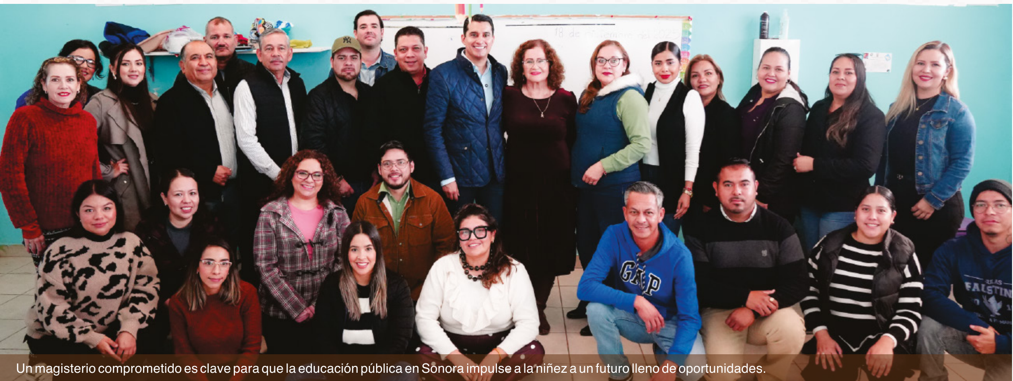
Un magisterio comprometido es clave para que la educación pública en Sonora impulse a la niñez a un futuro lleno de oportunidades.