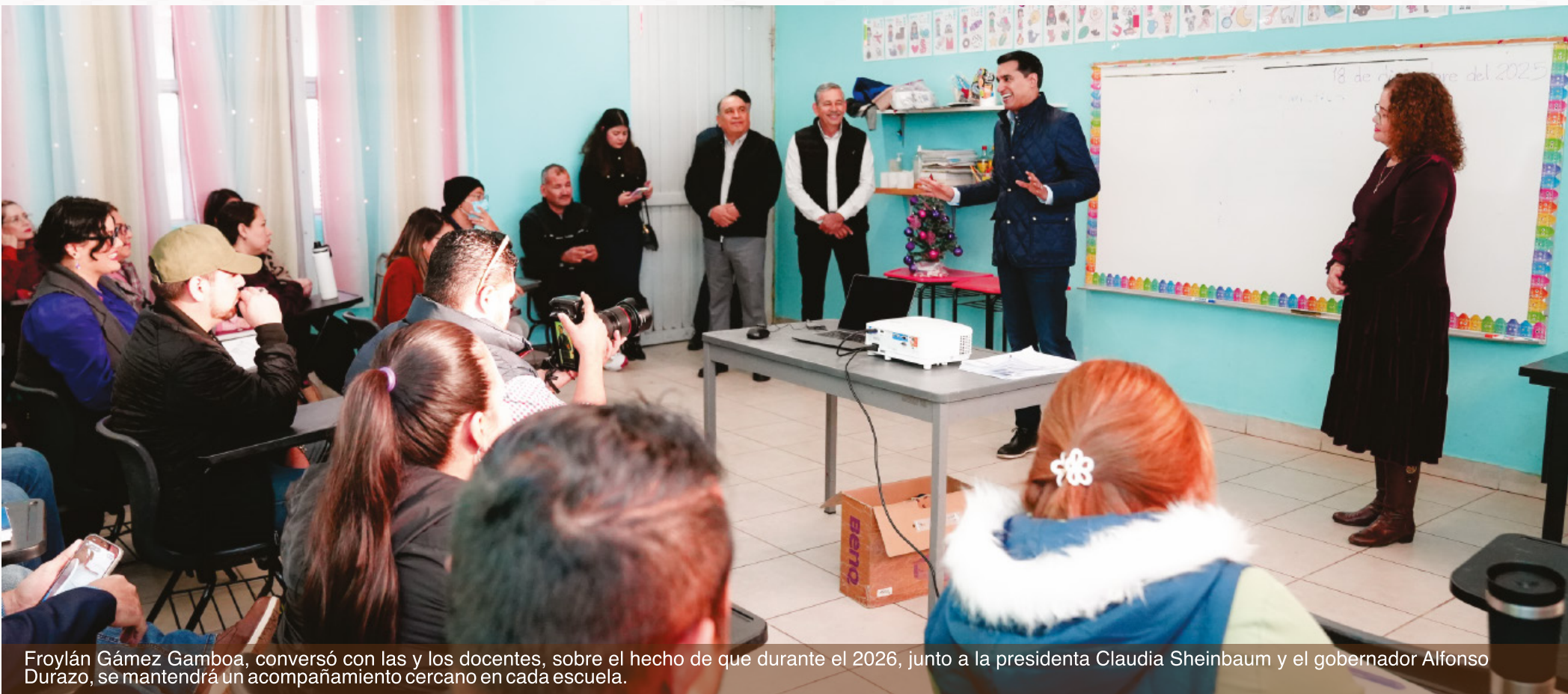
Froylán Gámez Gamboa, conversó con las y los docentes, sobre el hecho de que durante el 2026, junto a la presidenta Claudia Sheinbaum y el gobernador Alfonso Durazo, se mantendrá un acompañamiento cercano en cada escuela.