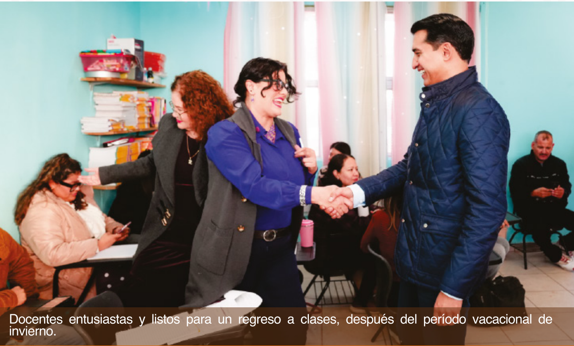
Docentes entusiastas y listos para un regreso a clases, después del período vacacional de invierno.