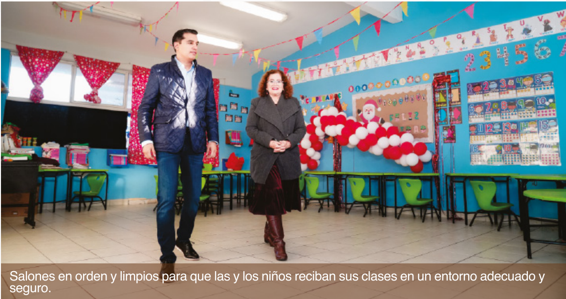
Salones en orden y limpios para que las y los niños reciban sus clases en un entorno adecuado y seguro.