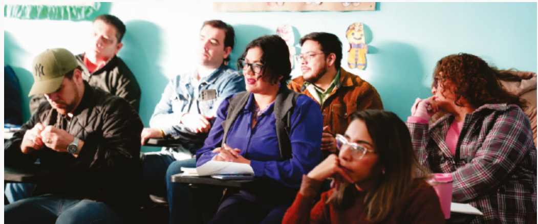
El magisterio se mostró dispuesto a regresar a sus labores de forma ordenada y aportando su granito de arena, para que todo fluyera de la mejor manera durante el retorno a las aulas.