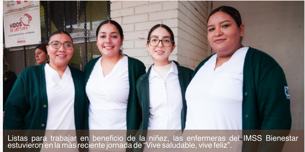
Listas para trabajar en beneficio de la niñez, las enfermeras del IMSS Bienestar estuvieron en la más reciente jornada de “Vive saludable, vive feliz”.