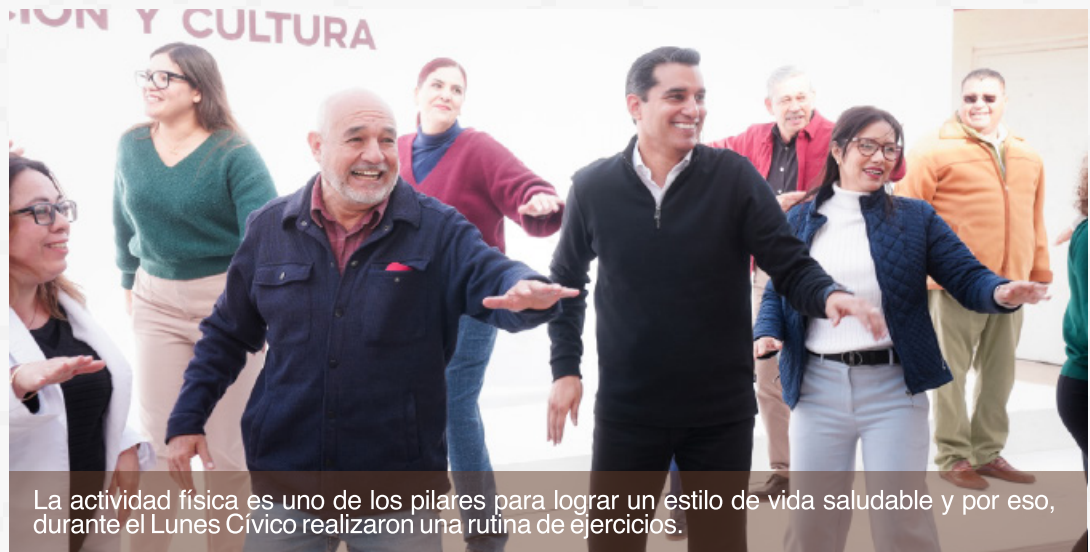
La actividad física es uno de los pilares para lograr un estilo de vida saludable y por eso, durante el Lunes Cívico realizaron una rutina de ejercicios.