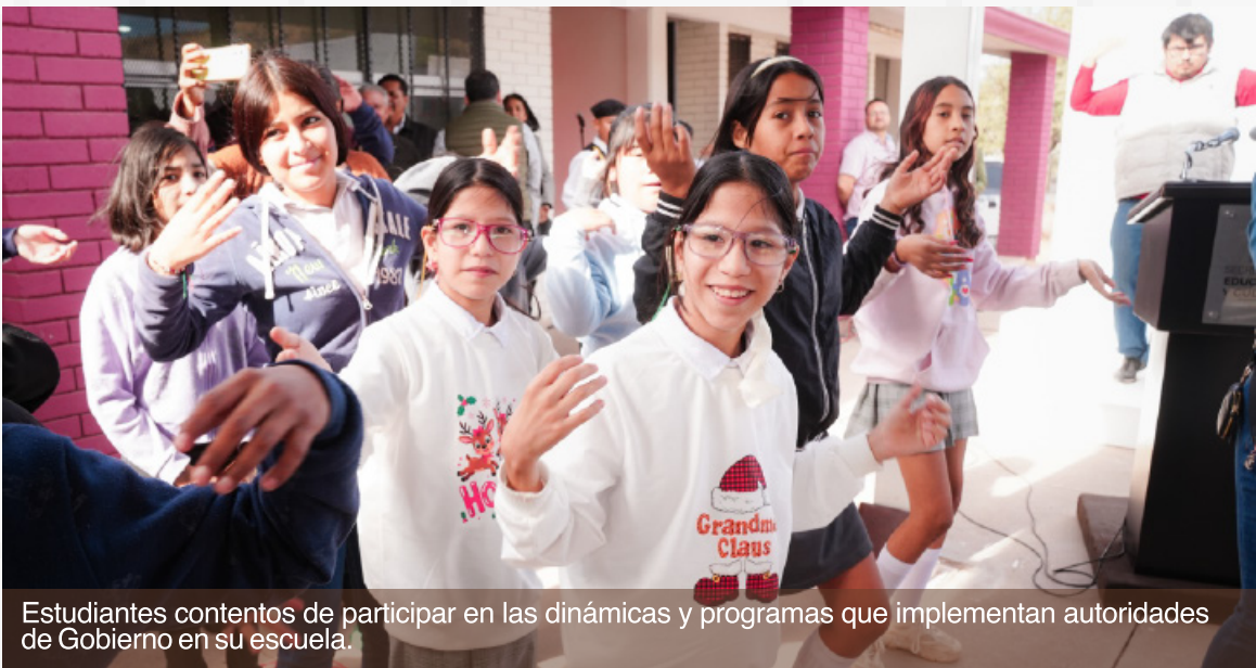
Estudiantes contentos de participar en las dinámicas y programas que implementan autoridades de Gobierno en su escuela.