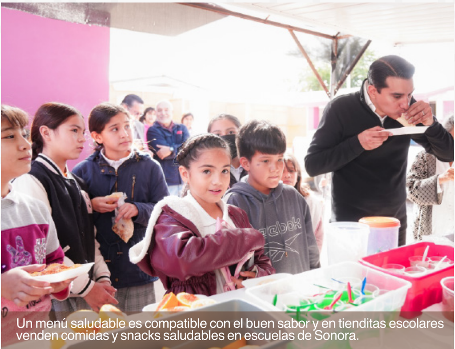
Un menú saludable es compatible con el buen sabor y en tienditas escolares venden comidas y snacks saludables en escuelas de Sonora.