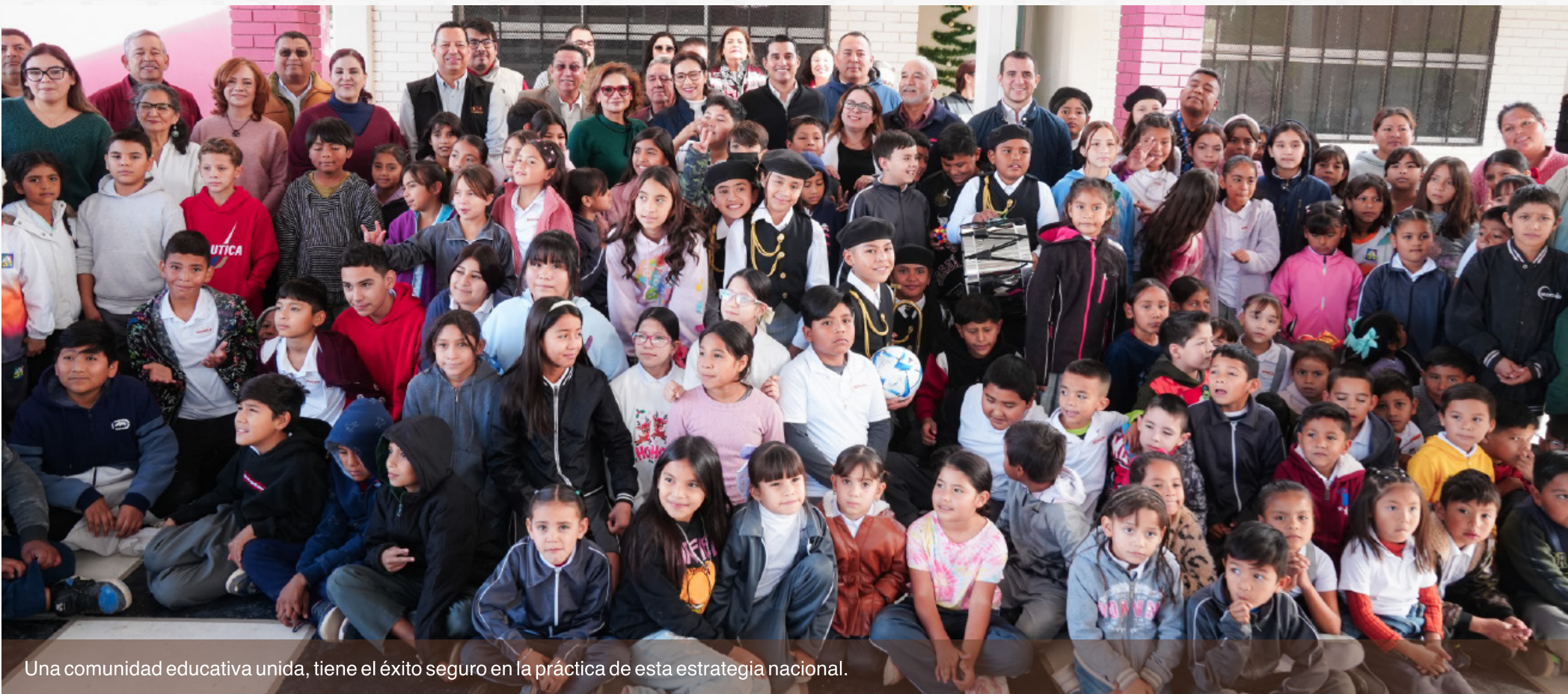
Una comunidad educativa unida, tiene el éxito seguro en la práctica de esta estrategia nacional.