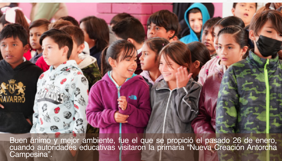
Buen ánimo y mejor ambiente, fue el que se propició el pasado 26 de enero, cuando autoridades educativas visitaron la primaria “Nueva Creación Antorcha Campesina”.