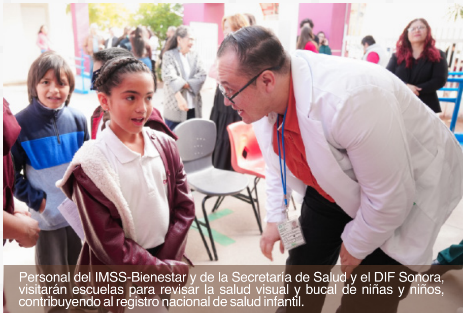
Personal del IMSS-Bienestar y de la Secretaría de Salud y el DIF Sonora, visitarán escuelas para revisar la salud visual y bucal de niñas y niños, contribuyendo al registro nacional de salud infantil.