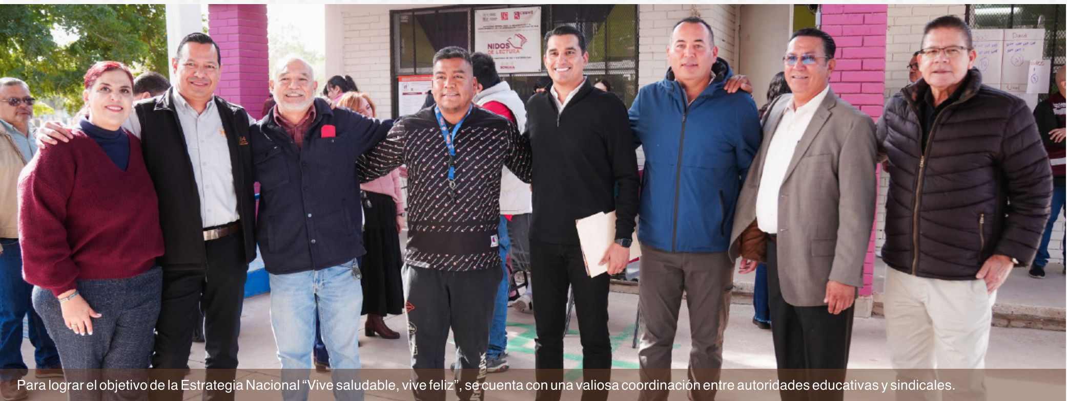
Para lograr el objetivo de la Estrategia Nacional “Vive saludable, vive feliz”, se cuenta con una valiosa coordinación entre autoridades educativas y sindicales.