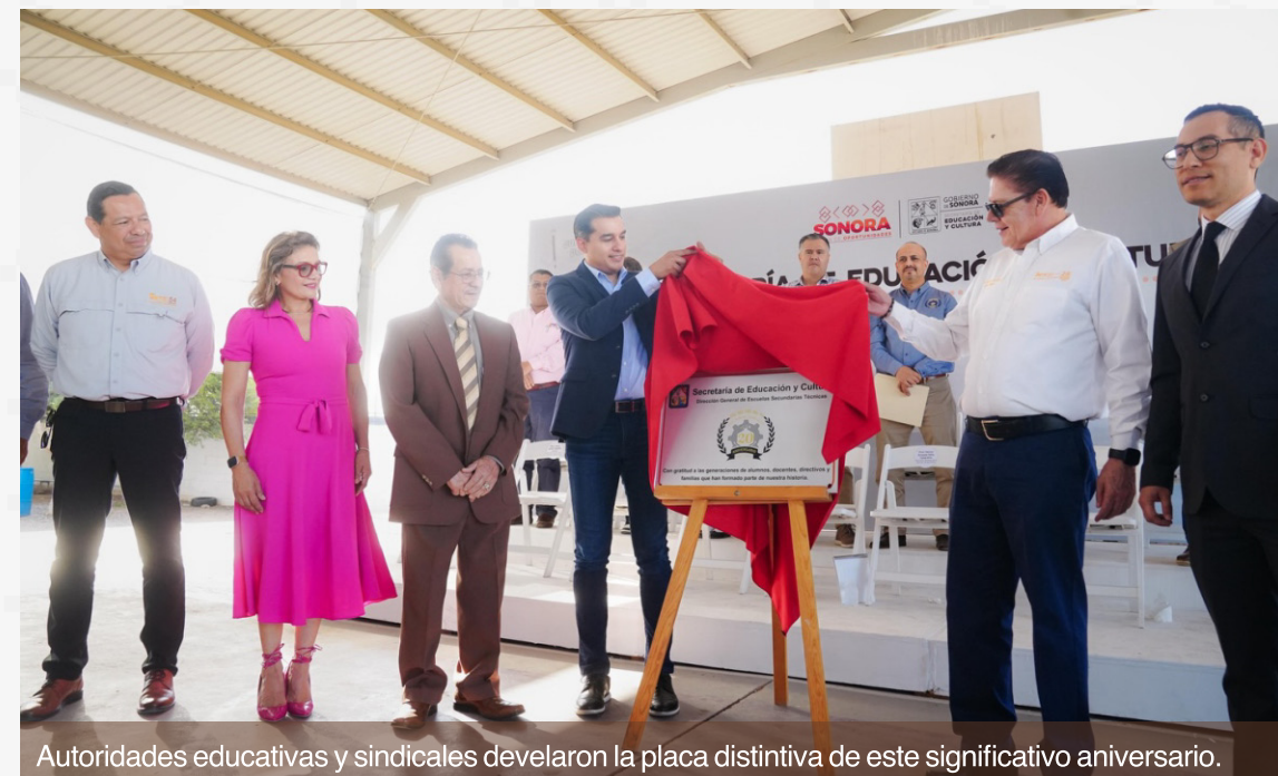
Autoridades educativas y sindicales develaron la placa distintiva de este significativo aniversario.