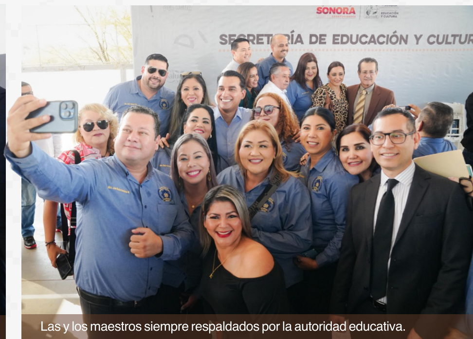
Las y los maestros siempre respaldados por la autoridad educativa.