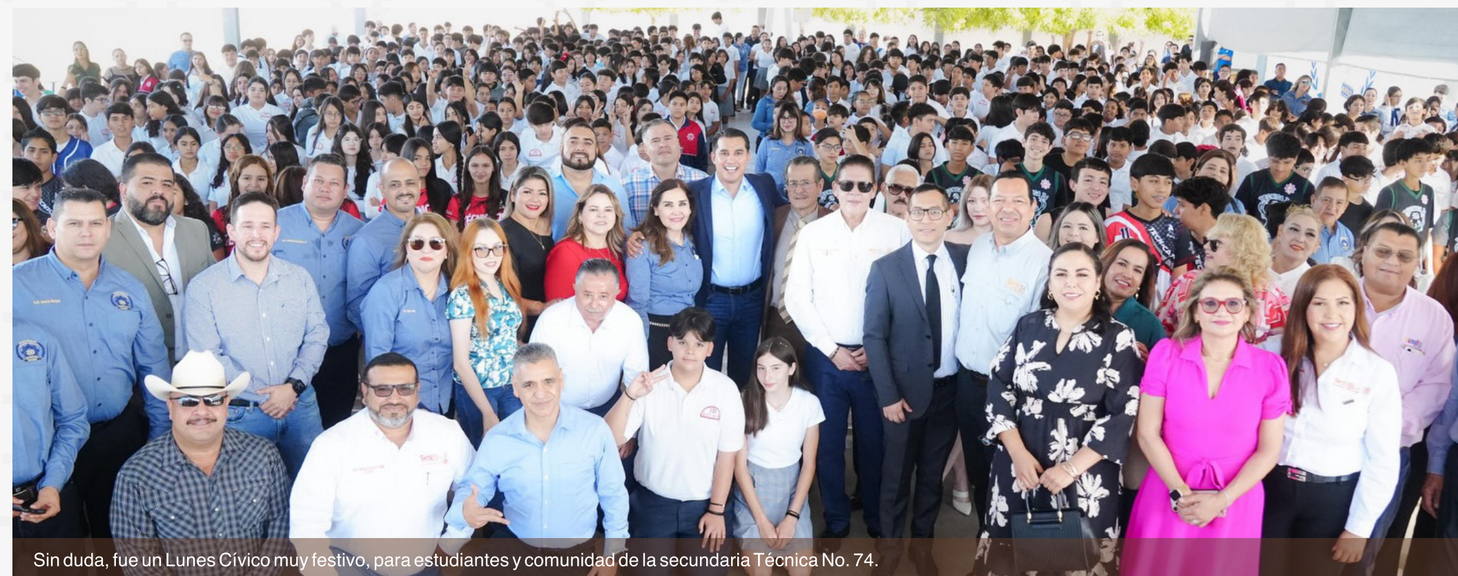
Sin duda, fue un Lunes Cívico muy festivo, para estudiantes y comunidad de la secundaria Técnica No. 74.