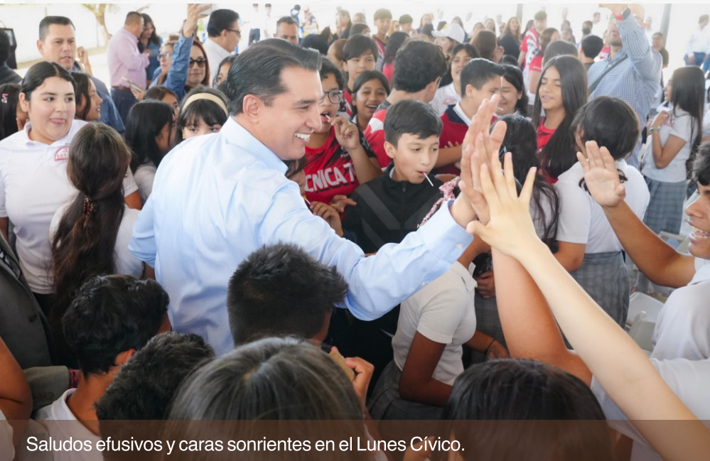
Saludos efusivos y caras sonrientes en el Lunes Cívico.

Reconoció a todas y todos quienes han hecho posible, 20 años de trayectoria académica de esta institución.