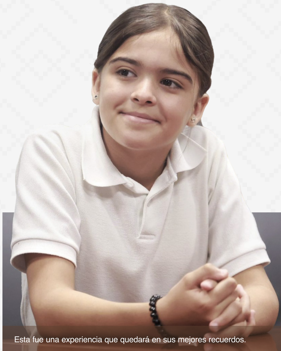
Esta fue una experiencia que quedará en sus mejores recuerdos.