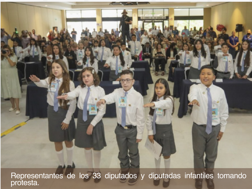
Representantes de los 33 diputados y diputadas infantiles tomando protesta.