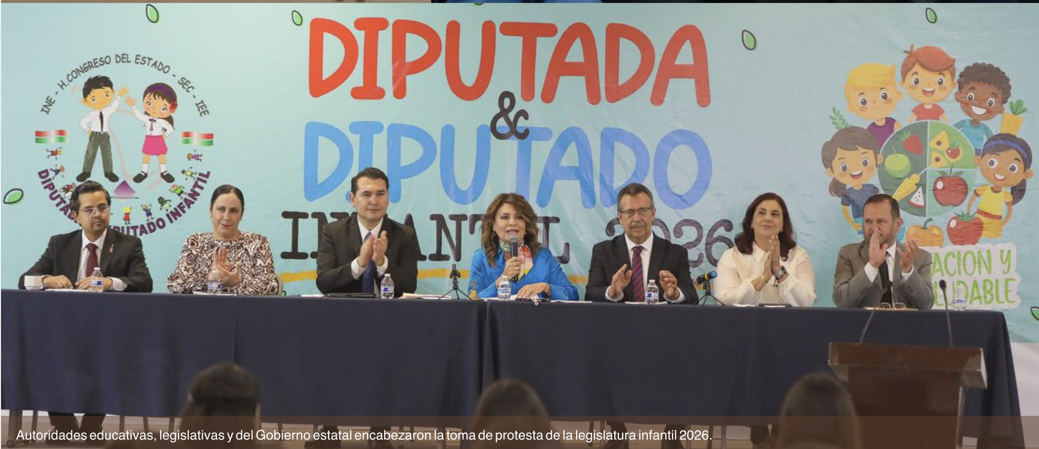
Autoridades educativas, legislativas y del Gobierno estatal encabezaron la toma de protesta de la legislatura infantil 2026.