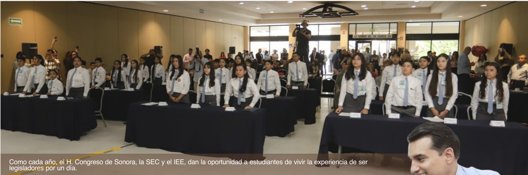
Como cada año, el H. Congreso de Sonora, la SEC y el IEE, dan la oportunidad a estudiantes de vivir la experiencia de ser legisladores por un día.