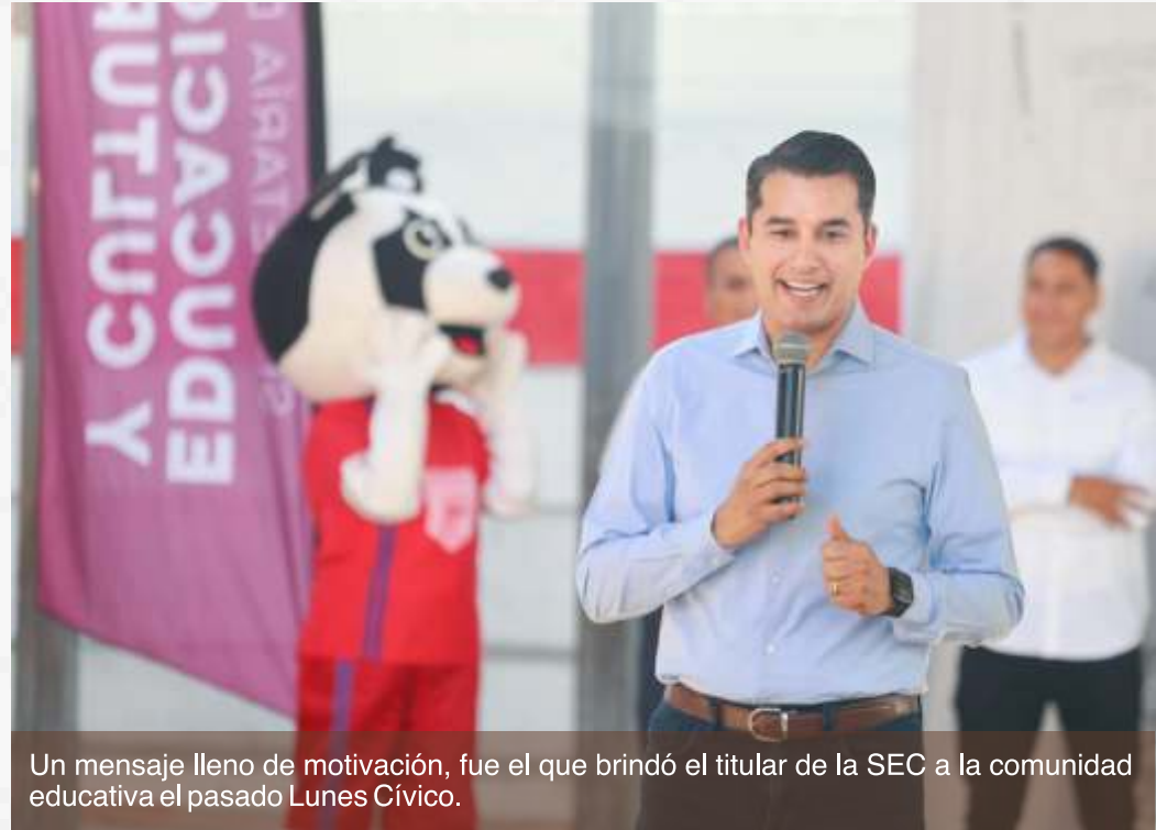
Un mensaje lleno de motivación, fue el que brindó el titular de la SEC a la comunidad educativa el pasado Lunes Cívico.