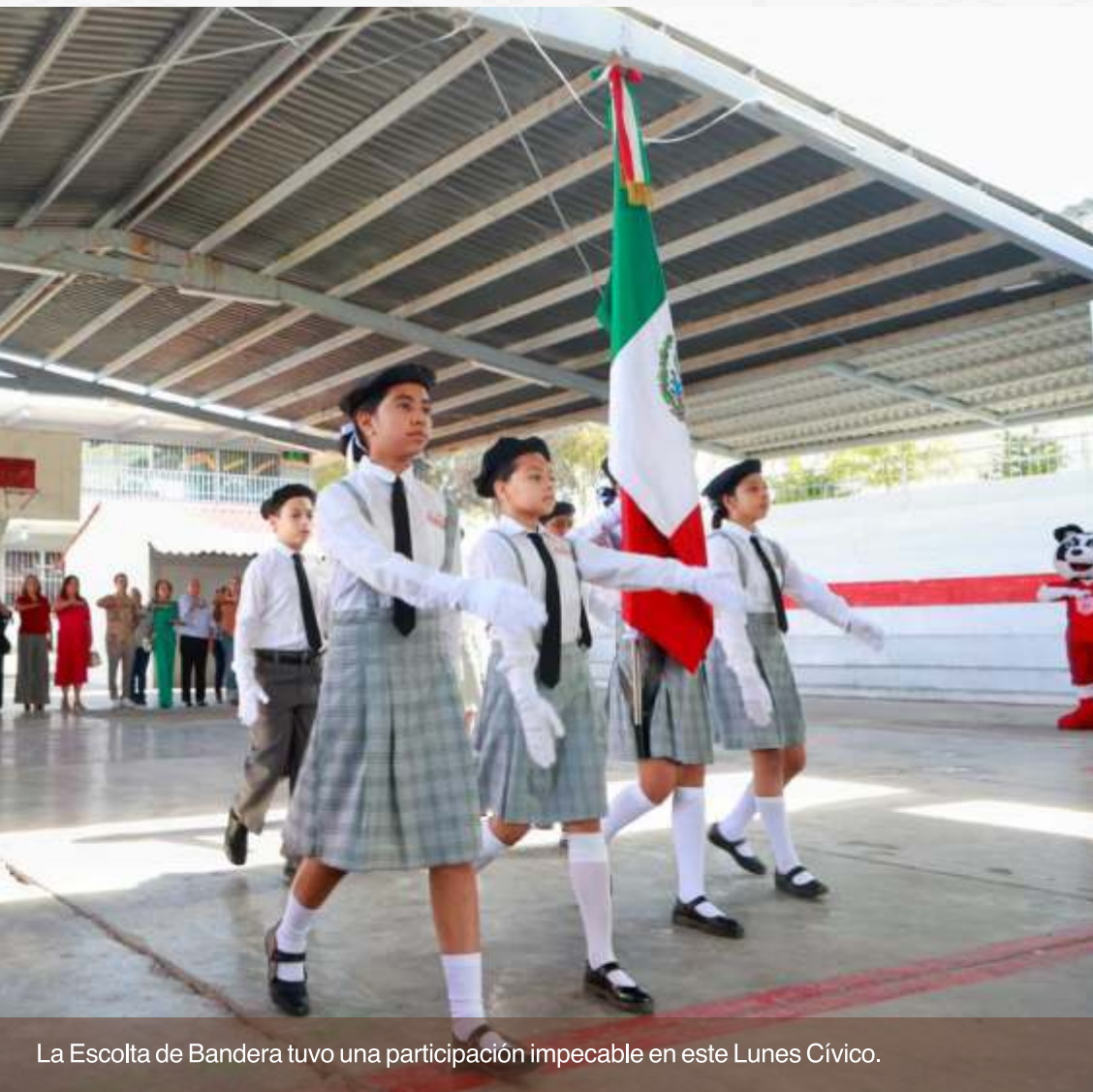
La Escolta de Bandera tuvo una participación impecable en este Lunes Cívico.