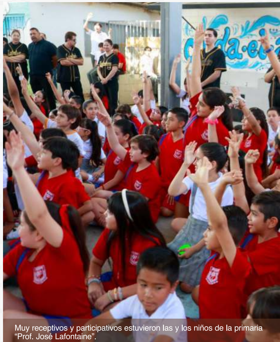
Muy receptivos y participativos estuvieron las y los niños de la primaria "Prof. José Lafontaine".