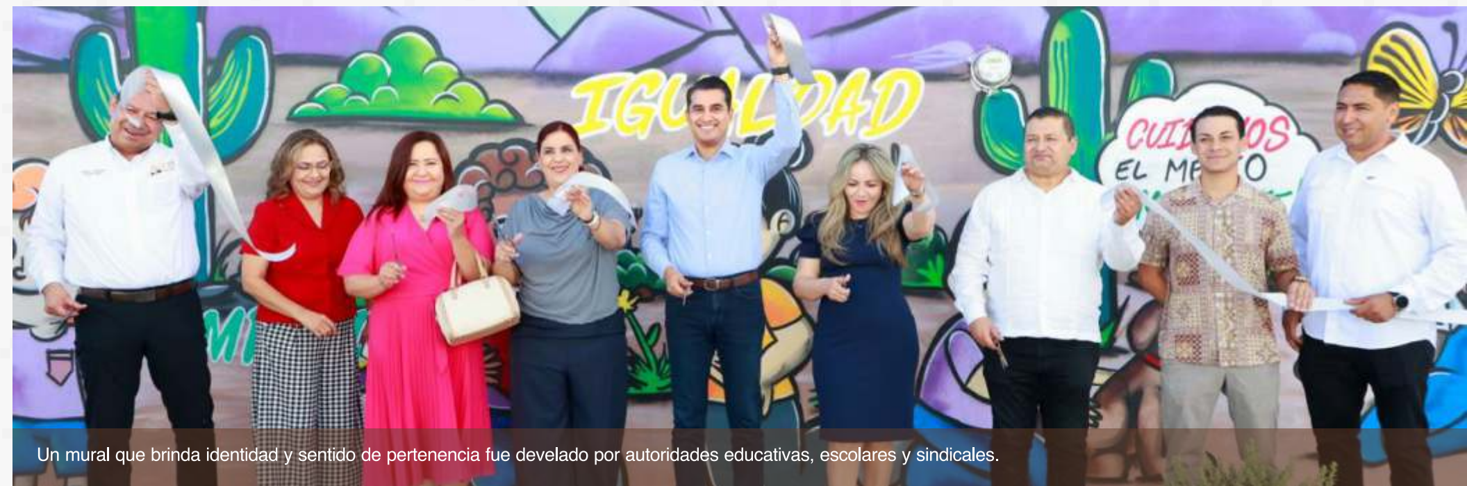
Un mural que brinda identidad y sentido de pertenencia fue develado por autoridades educativas, escolares y sindicales.