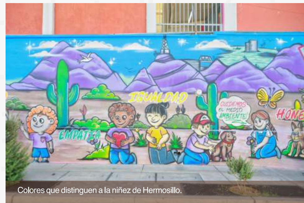
Colores que distinguen a la niñez de Hermosillo.