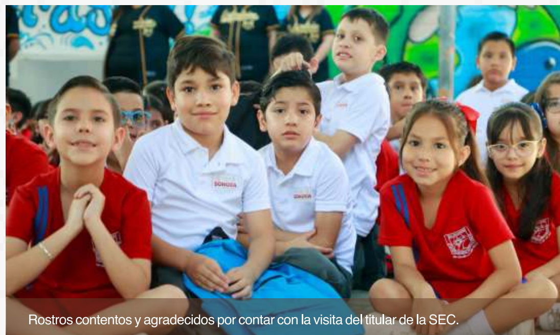
Rostros contentos y agradecidos por contar con la visita del titular de la SEC.